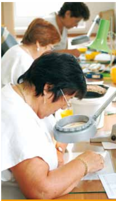
Éles szemmel figyelnek a laborban