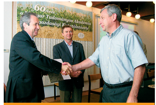
A VSZT elnöke átveszi az MNE emléklakettet

Az egyesület természetes szövetségeseivel, a Vetőmag Terméktanácsal (VSZT) folyamatos kapcsolatot tart. Az MNE elnöke tanácskozó tagja a VSZT elnökségének. Ennek szellemében rend-