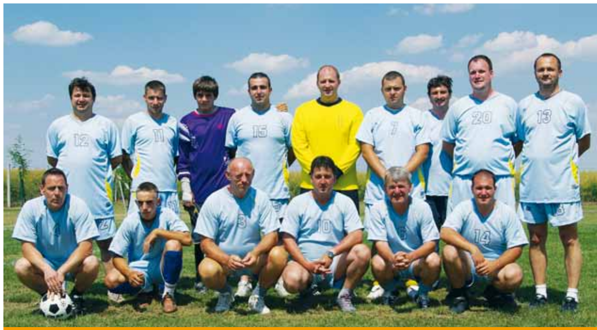
A győztes csapat

A végeredmény: 1. Hódmag 2. BázisMag Kft. Martonvásár 3. MgSzH