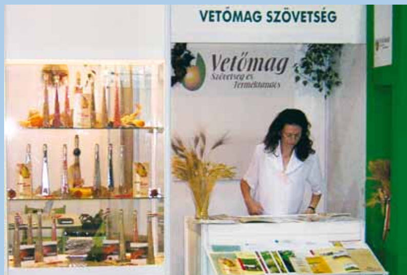
VSZT stand a 2005. évi OMÉK-on

Kérjük, járuljanak hozzá, hogy a VSZT megjelenése minél színvonalasabb és informatívabb legyen.